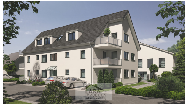
MFH Straßenansicht rechte Seite