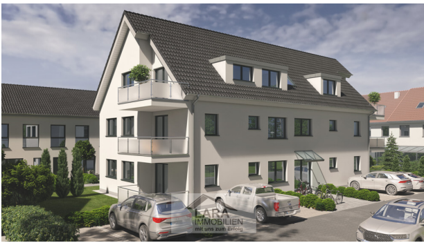
MFH Straßenansicht linke Seite