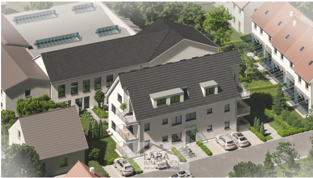
MFH Straßenansicht Vogelperspektive